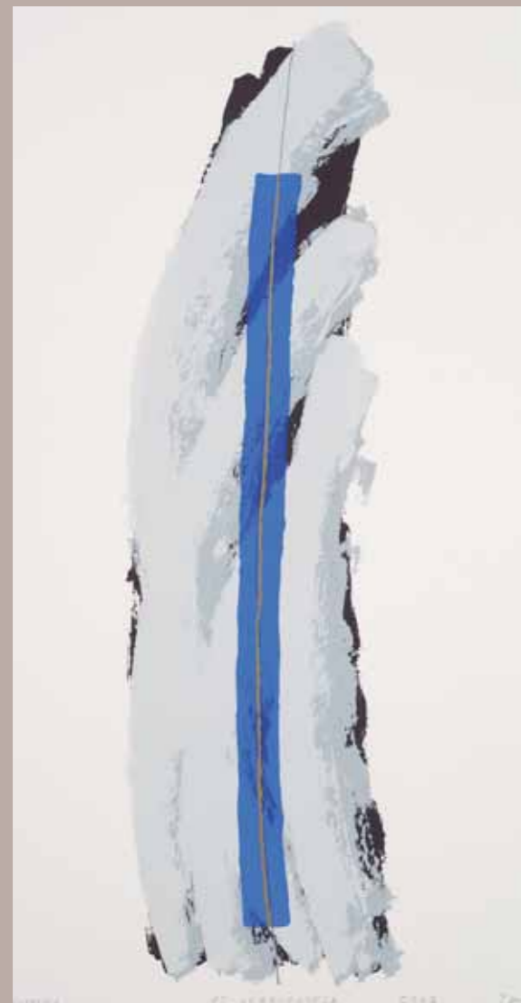
Os nezavednega, 50 x 35 cm, sitostisk, 2007