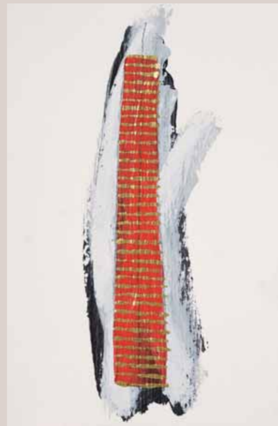
Vmesni prostori, 14 x 11,5 cm, akril na kartonu, 2007

Na naslovnici: Modrina upanja, 14 x 11,5 cm, akril na kartonu, 2007 Odpri, 14 x 11,5 cm, akril na kartonu, 2007