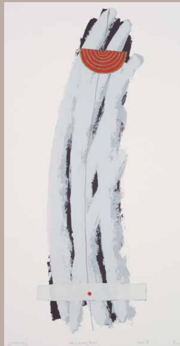
Medprostori, 50 x 35 cm, sitotisk, 2007