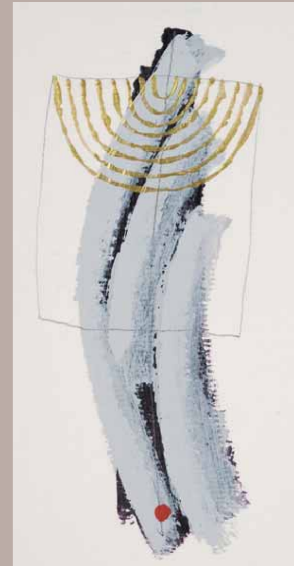
Točka – začetek, 14 x 11,5 cm, akril na kartonu, 2007