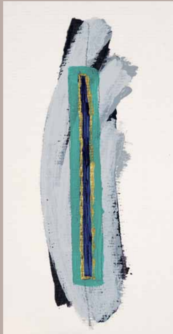
Neizrekljiva bližina, 14 x 11,5 cm, akril na kartonu, 2007

Prevladuje centralna kompozicija z vodoravnim ali navpičnim poudarkom, z bolj ali manj enakomerno ritmizirano razporeditvijo vseh sodelujočih likovnih prvin, ki vnašajo v podobo dodaten pomen, magično razsežnost in vznemirljivo ozračje. Tako harmoničnim zasnovana kompozicija skupaj z ritmično dinamičnim učinkom živih barv (zlate, modre, zelene in rdeče) deluje v belih, širnih prostorih slik skoraj zvočno – kot melodija, ki je ne bi smeli preslišati, kot želja po bližini, ki je ne bi smeli nikoli prezreti.